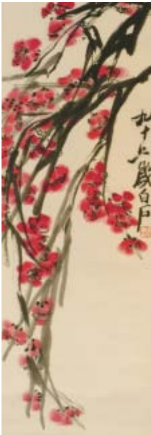
Chi Pai-shih, Pflaume Farbholzschnitt, Werkstatt Jung Bao-dsai

Sublimierung und nach einer Vereinigung mit tao, dem geistigen Prinzip, das jegliche Form von Sein durchströmt und damit gleichzeitig alles verbindet.