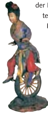
Dachreiter eines Akrobatentempels, Taiwan, 20. Jahrhundert

Der persönliche Blick schafft punktuellen Zugang zu einer fremden Welt, zu einer anderen Kultur, die als solche jedoch diffus und verschwommen bleibt wie der Durchblick durch die schwarze Vergitterung, die Buchheim beim Besuch der