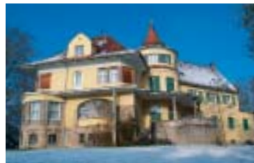
Villa Maffei

Kombiticket Villa Maffei/Buchheim Museum pro Person € 10,-