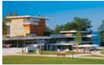
Buchheim Museum